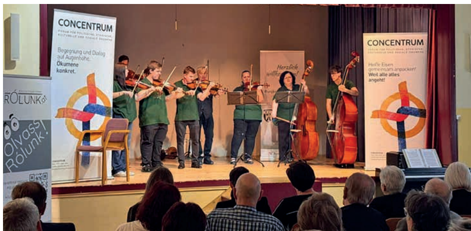
Musiker:innen des Kulturvereins