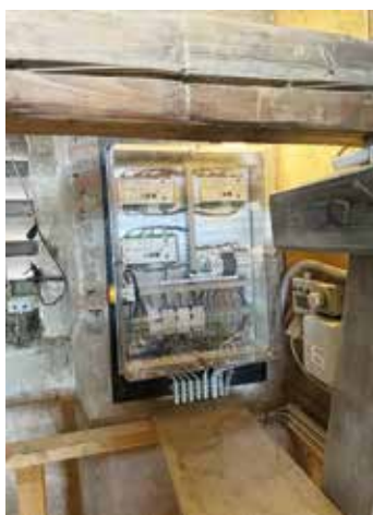
Neue elektronische Steuerung