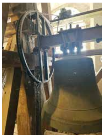
Elektromotor mit Zugrad

Die automatische Läuteanlage der drei Glocken in der Evangelischen Pfarrkirche Oberschützen steuert sowohl programmierte Läutezeiten über das Jahr als auch die Glockenbewegung,